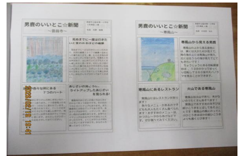
<3年男鹿のいいところ★探検隊 パンフレット（抜粋）>

2月17日、今年度最後のPTA授業参観・学級懇談会を実施しました。この一年間の成長を見ていただこうと、張り切って授業に参加していました。1年生は「できるようになったこと・お得意発表会」、2年生は「体育：親子でキックベースボール」、3年生は「男鹿のいいところ★ほうこく会」、4年生は「4梅の成長を笑顔で伝える会」、5年生は「おにぎりパーティー（収穫感謝祭）」、6年生は「未来探検隊のまとめの発表」を参観していただきました。3年生の発表がまとめられたパンフレットは、なまはげ柴灯祭り会場で配られたり、観光客の方が自由に持っていってもらえるようにオガレやなまはげ館などに置かせていただきました。