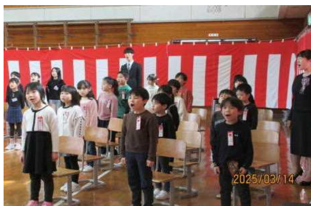
<在校生も大きな声で頑張りました>

卒業生の保護者の皆様、お子様のご卒業おめでとうございます。心よりお慶び申し上げます。これまで、6年間の長きにわたり、本校教育へのご理解と多くのご支援をいただき、ありがとうございました。