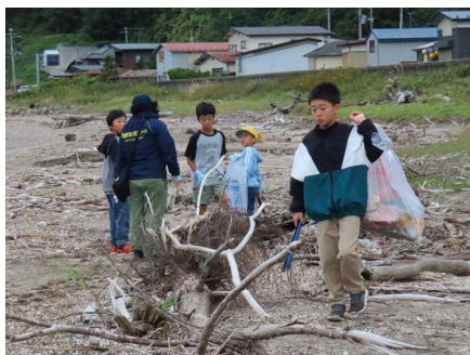
<脇本海岸のクリーンアップ>