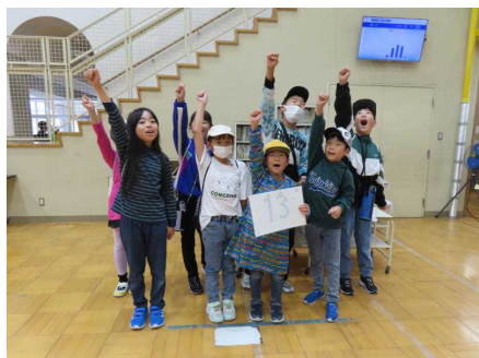
<気合いを入れて出発>