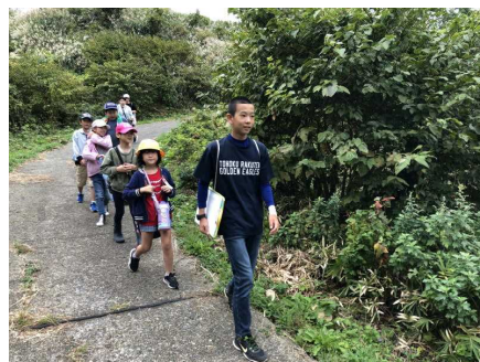
<6年生が優しく先導します>

全校縦割りのなかよし班でクイズやチャレンジ問題に挑戦する、毎年恒例の全校ウォークラリーを実施しました。心配していた雨も降ることなく、楽しく活動しました。6年生が下級生に優しく声を掛け、面倒をよく見ていました。リーダーとして成長した頼もしい6年生の姿が見られました。昼休みには、結果発表・表彰が行われ、その後、なかよし班ごとに「だるまさんがころんだ」や「フルーツバスケット」など、6年生が計画・準備した内容でなかよく遊び、楽しい一日となりました。