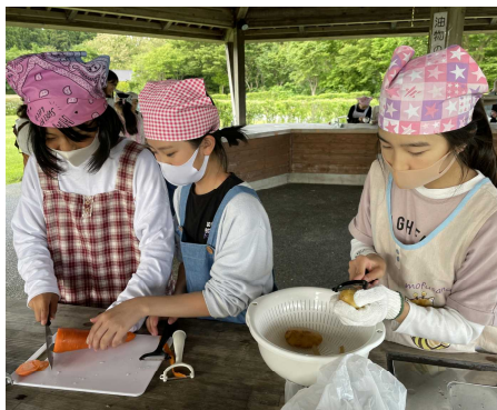
<カレーの調理に挑戦>