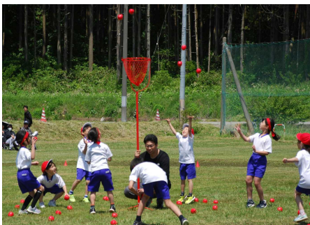
<1・2年 ダンシング玉入れ>