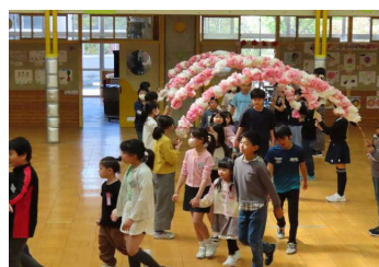
<花のアーチで入場>