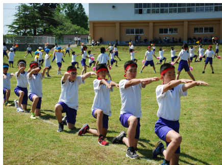
<マスゲーム 脇一の花>

当日、運動会運営等にご協力くださったPTA保健体育部、校外指導部の皆様をはじめ、日頃からの保護者・地域の皆様のご協力に心より感謝申し上げます。今後とも、子どもたちの健やかな成長のため、ご支援ご協力を賜りますようお願い申し上げます。