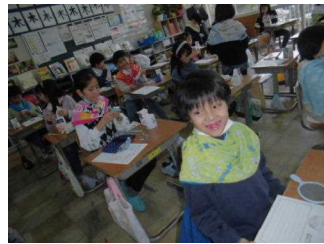
染め出しを使った歯みがき指導の様子