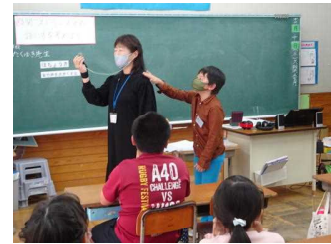
3年 難聴や補聴器を使う人にどう伝える？