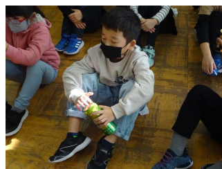
2年 身近な物に使われている点字

11月中旬に3回に分けて、全学年で障害理解の出前授業を実施しました。「障害のある人・ない人」という見方をしていると、必要な支援が分からなかったり思い違いをしたりことも多いようです。様々な障害を体験を通して理解できるようにするため、学年毎にテーマを決め、継続的に学習するようにしています。