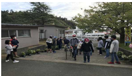
10月のあいさつ運動の様子

男鹿市では「読書運動」「あいさつ運動」「体づくり運動」の、3つの市民運動を推進しています。本校でも、毎週月曜日、児童会によるあい