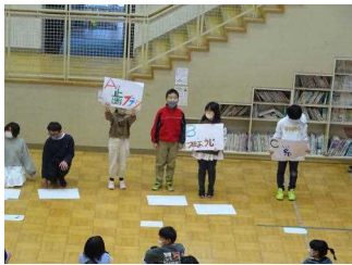
クイズ「歯のすき間をきれいにしやすいものは？」

委員会が担当する全校集会の様子です。11月は健康委員会と図書委員会の担当でした。各学年で、養護教諭による歯みがき指導を行うのに合わせ、健康委員が三択クイズを準備し、歯みがきの知識を確かめました。