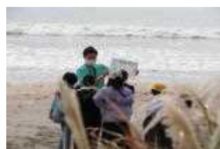
プラごみのクイズも出題