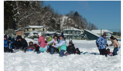
青空の下雪遊びを楽しむ3年生

学校では、新入生の体験入学の中止や、卒業証書授与式へのご来賓の招待を中止するなど、感染防止策を進めています。今後も急な変更となる場合がありますので、お便りや緊急メールなどの確認をよろしく願いいたします。