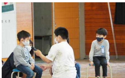
いろいろな「好きなもの」を答えます

5月19日にはなかよし班の顔合わせも行われ、今後なかよし清掃やウォークラリーなどで交流を深めていくことになっています。