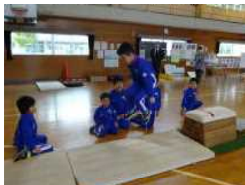
2年体育科の研究授業の様子

学力の向上と教職員の授業での指導法を改善するために、研究主題「学び合い、考えを深める子どもの育成～自ら学びをつなぐ授業づくり～」を掲げて進めてきました。後期には、県教育庁中央教育事務所の指導主事や県立支援学校、市内小・中学校等から指導者をお招きし、特別支援教育セミナー(特別支援学級の授業研究会と全職員対象の特別支援教育に係る研修会)や体育科・社会科・外国語科の授業研究会を行いました。主体的に学ぶ子どもたちの姿にも前期からの成長を感じることができました。