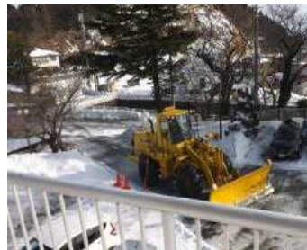
「除雪車、すごい! 迫力ある!」

大荒れの暴風雪の天気となり、正月明けのまとまった積雪量には驚かされました。脇一小では、積雪の他、雷により体育館の電気ブレーカーの故障がありました。玄関前の校庭や駐車場の除雪には、脇本公民館からお借りしている除雪機が早朝からフル稼働の状況でした。ご近所様からは、ご厚意で駐車場の登り口の坂を除雪していただいた日もありました。また、市教委・市建設課を通して、県道・市道の除雪を担う重機も入った除雪日もありました。