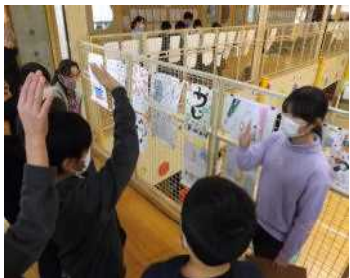
「金、銀、銅賞を決めますよ!」

今年も恒例の新春図画コンクールに、力作や傑作がたくさん出品されました。お正月や冬休みらしい図柄から、人気アニメのイラストまで観ているだけで楽しくなる作品ばかりです。表現方法も、水彩絵の具、パステリック、色鉛筆、ちぎり絵など様々です。そして、このコンクールの一番の特徴は、審査方法にもあります。児童会の各委員会(4年生以上)で対象学年を分担して、話し合いで各賞が決められることです。随分悩みながら決めていましたよ。