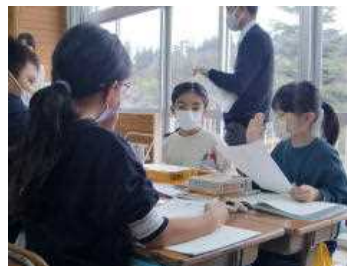
3年社会科の研究授業の様子