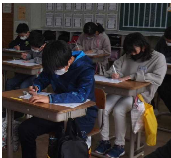
6年「チャレンジテスト」の様子