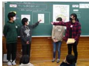
6年外国語科の研究授業の様子