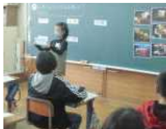
4年社会科の研究授業の様子