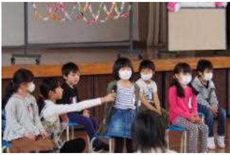
インタビュー「好きな果物は、イチゴです。」