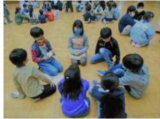
仲良く活動しようね！

また、班長さんの掛け声に合わせて、思い思いのポーズをきめ、笑顔いっぱいの班写真も撮りました。