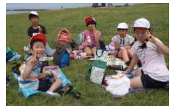
キャラ弁集合！ 昨年までの校外学習の昼食にて

ルバスや市有バスを利用した校外学習は、7月以降に延期することになりました。これは、現時点で、バス移動時の長時間の密状態の回避、受け入れ先の諸事情等を考慮した上でのことです。