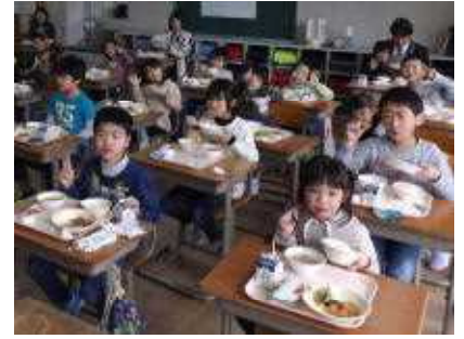
2年生「教室での給食の様子」

再開初日の献立は、人気No.1のカレーライスの中から、シーフードカレーライスにビーンズサラダ、福神漬け、牛乳でした。もちろん完食の子どもたちが続出でした。ただ、例年この時期からは、1階のグルメシヤトル(食堂)で全校一堂に会しての給食が始まるのですが、3密を避けながら分散し、対面にならない座席配置で給食をいただいている状況です。「楽しい会食」ができるまでにはしばらく時間がかかりそうです。