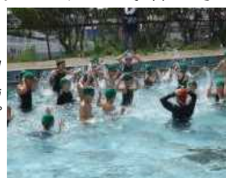
1年生も水遊びに夢中だよ！

★学校沿革史には「昭和39(1964)年…脇本浜に水泳場設置/昭和47(1972)年…プール竣工」と記されています。現在のプールの年齢は、満48歳ということになります。