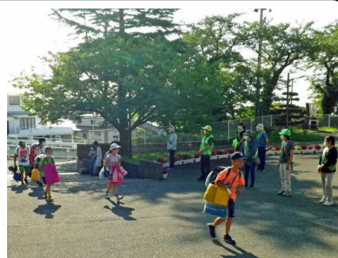
子どもたちに声をかける民生児童委員の皆さん

夏休み明けの初日(8月24日)、夏休みの課題作品や花鉢などを手にして登校する子どもたちに、温かく、爽やかに「おはよう!」と声をかける脇本地区民生児童委員協議会(〇〇〇〇会長)の皆様がありました。4月からこれまで、新型コロナウイルス感染症拡大防止を考慮し、本校でのあいさつ運動の実施を控えていたので、今年度初めての実施となりました。それでも、感染予防には細心の注意を払い、相互に一定の距離をとり、マスクを着用しての実施となりました。〇〇会長は、「元気な子どもたちの姿を見ることができてうれしくなりました。地域の中でも子どもたちを見かけたら声かけをしていきたいです。」とおっしゃっていました。