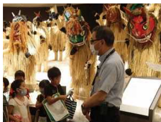
泣く子はいねよ！(本当?)

2年生が校外学習(なまはげ館・男鹿水族館GAO)に出かけてきました。なまはげ館では、男鹿市内各地区のなまはげの姿に圧倒されました。また、各地区によってなまはげの作りや表情に違いがあることに気付きました。「お山の上から、ちゃんと言っているがしっかり見でるがらな！」というなまはげの声が聞こえてくるようでした。