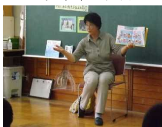
身近な所から平和を見つめてみよう！

3年前、本校で非常勤講師を務めた〇〇〇〇さん(元・〇〇〇〇〇/〇〇在住)による読み聞かせ会が6年生を対象に行われました。今年は、先の大戦終結から75年目にあたります。特に8月は、広島、長崎、秋田市土崎の空襲、終戦のあった月です。身近にある「戦争」を伝えるもの・ひと・ことから「平和」について考える学習になりました。