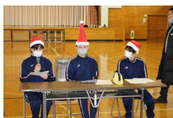
球技大会で司会する執行部

前期生徒会は「Tomorrow Together ～輝き 続ける 北中に～」、後期は「Best and Last ～一 生の思い出に～」をテーマに、今までの伝統を 引き継ぐとともに思い出に残る一年間にしたい という思いのもと、日々の活動や行事に意欲的 に取り組みました。体育祭、文化祭、なべっこ、 球技大会など、どれも生徒 たちがアイディアを出し合 って充実した行事になりま した。3月の3年生を送る 会も楽しみです。