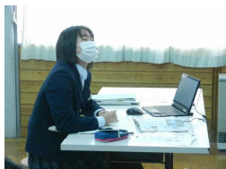
社会科での調査活動

週に1度ほど、授業でタ ブレットを活用しています。 夏休みや冬休みには自宅に 持ち帰ってオンライン学活 やレポート作成を行うなど、