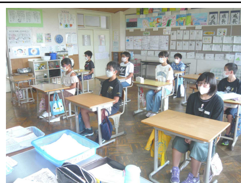
放送で行われた全校集会で真剣に話を聞く子どもたち。大変立派でした。

さて、今年の夏も野球で熱くなりました。ご存知の通り、東京で開催された全国大会で本校の児童が所属する「脇一鴻西野球少年団」の活躍です。球場に駆け付けることはできませんでしたが、インターネットでの配信を通じてハラハラドキドキしながら声援を送っていました。最後まであきらめずにプレイする姿には元気と勇気を貰うことができました。見事な全国ベスト16でした。憧れの神宮球場で試合をするという目標に向かって日々がんばってきた子どもたちを大いに讃えたいと思います。