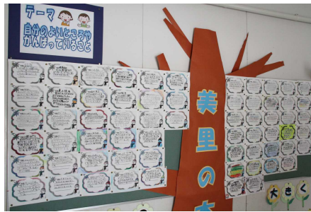
「みんなのあったかい心で大きく育つ『美里の木』」コーナーに各自の「自分のよいところ、がんばったこと、成長したこと」などが掲示されています。