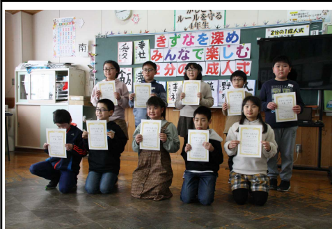
4年生「二分の一成人式」で、一人一人に二分の一成人証が授与され、立派に将来の夢を発表しました。