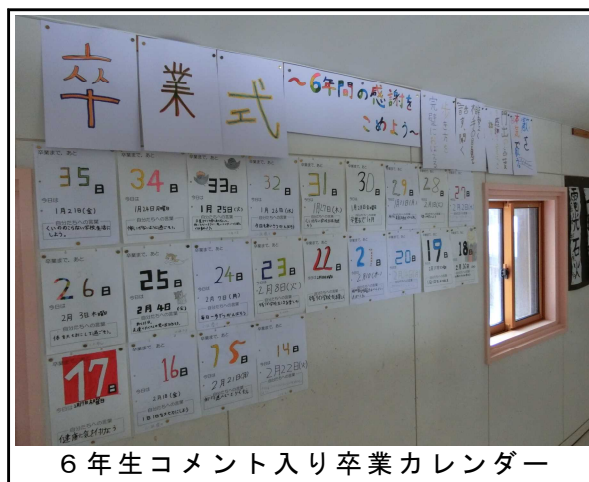
6年生コメント入り卒業カレンダー

6年生の教室前の廊下壁面には、卒業までのカウントダウンカード（卒業カレンダー）が掲示されています。毎日一つずつ数字が減っていくカードに、6年生の皆さんの一言が添えられています。その一文を読みながら、感慨にふけるこの頃です