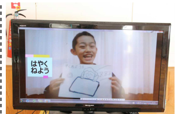
児童会の健康委員会の子どもたちが、健康保持のために規則正しい生活の呼びかけ動画を作成しました。毎朝、玄関前で動画を流して呼びかけをしました。