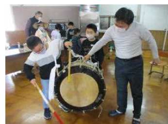
福米沢の送り盆行事の学習

ありがたいことです。本校では開校以来、宮沢海岸のクリーンアップを行っています。今年度、地域の方々にご案内を出し、一緒に活動したいと考えていましたが、コロナ禍のために実現できませんでした。その他にも地域の施設の訪問など、残念ながらできないことがありました。今後も、地域の方々にお世話になるだけでなく、コロナの様子を見ながら学校が地域のために、地域と共にできることを考え、“ふるさと男鹿”に触れる機会を大切にし、そのよさを実感できるような取組を進めたいと考えています。