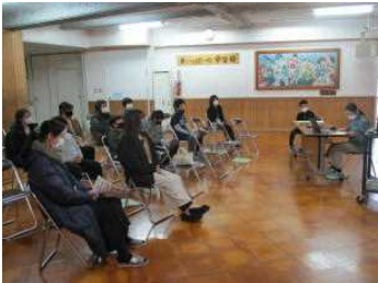
5年：美里米っこ探検隊