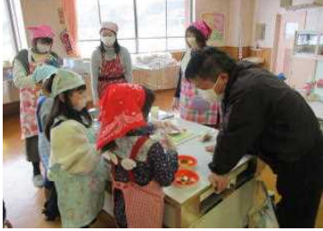
2年：親子でクッキング