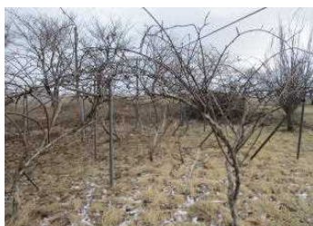
剪定して下さったキウイの木

15日の朝、農園の後ろの木々が剪定されていることに気がきました。枝が伸び放題になっていたキウイの木も、さっぱりとした状態になっていました。地域の方が土曜日と日曜日にやってくれました。本校は、地域の方々には本当にお世話になっており、このような環境整備の他にも、農園やたんぼ・梨園での収穫体験や、箏の演奏や書写などの授業は、実体験を通して学ぶ貴重な機会となっています。また子どもたちはボランティアの方の読み聞かせを非常に楽しみにしており、読書が好きな子が確実に増えています。本当に