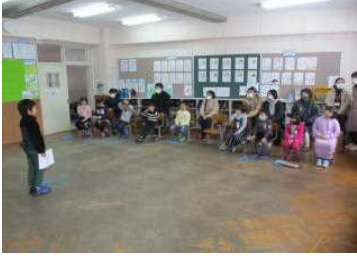
1年：できるようになったよ

2月19日、今年度最後のPTA授業参観、学級懇談を行いました。当日はそれまでの寒さが少し和らいだとはいえ、春の到来にはまだほど遠い天候でしたが、たくさんの保護者の方が来校してくださいました。1・6年生は今年1年を振り返っての発表、5年生は1年間取り組んできた米作りについての発表でした。4年生は10歳になる学年ということで、2分の1成人式を行い、一人ひとりが自分の夢を発表しました。2年生と3年生は親子学習会ということで、2年生は家庭科室で親子クッキングを、3年生は体育館でドッジボールなどをして、保護者と一緒に楽しいひとときを過ごしました。