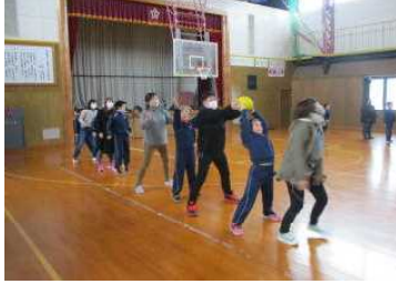
3年：親子でボール送り