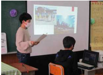
6年：行事を振り返っての発表