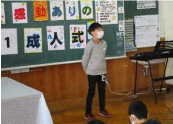
4年：夢の発表（2分の1成人式）