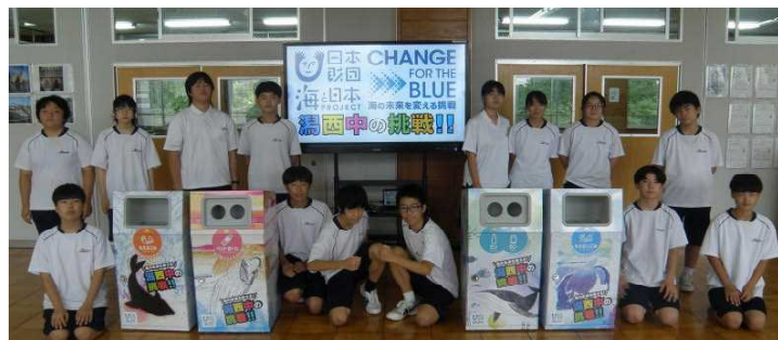
五里合海水浴場に設置するごみ箱のデザイン

2年生が海洋ごみを削減する「海と日本プロジェクト」の取組の中で、秋田テレビ(AKT)さんのご協力のもと、五里合海水浴場に設置するごみ箱のデザインを考えました。生徒の原案をもとにしたごみ箱が完成し、この夏、海水浴場で重宝されたようです。このプロジェクトの中で、7月にババヘラアイスとのコラボ企画をしたり、9月に県立大の先生による授業があったり、2年生がたくさんの取組をしていますので、今後も紹介していきます。応援してください。