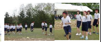
▲接戦を極めた長縄跳び