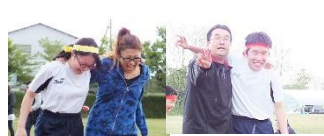
▲笑顔満開の3年レク