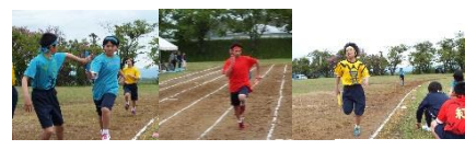
▲バトンをつなげ！全員リレー