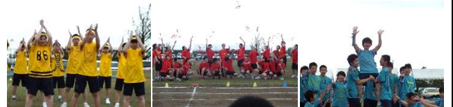
▲各色の団結力で完成度を高めた応援パフォーマンス