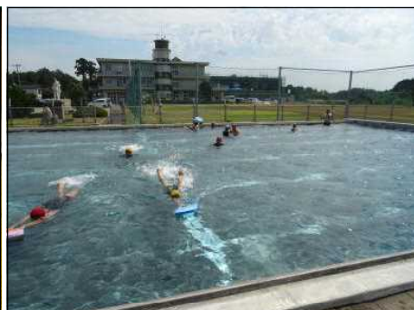
まだまだ夏!? 初日から水泳学習

7/6 第9回男鹿市潟上市南秋田郡小学生バレーボール交流大会 準優勝 北陽バレーボールスポーツ少年団