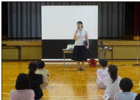
夏休み明け集会 8 / 23