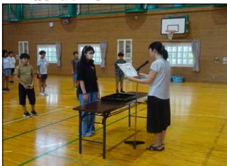
席書会の表彰を行いました