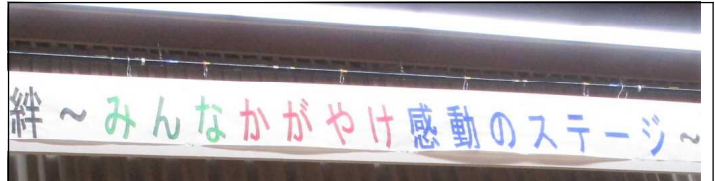
児童会考案のテーマ看板、出番待ちの状態です！

「山粧 やまよそお う」の言葉通りに、校舎から見える真山の紅葉が日に日に色濃くなってきました。毎年この時季になると、本校では各学級の「朝の歌」に「秋田船方節」や「ハタハタ音頭」が加わり、学習発表会への気運が高まっています。児童数が30名と過去最少となりましたが、その分一人一人が担う役割は大きいものがあります。