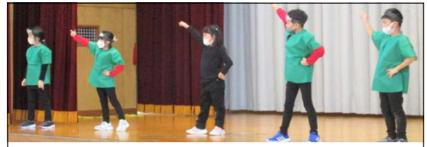
ノリノリです！2年生の練習風景

新型コロナウイルス感染症対策の一環で、ご家族の入場制限は設けませんが、来賓の皆様へのご案内は控えさせていただきます。ご来場の際には、感染対策へのご協力をよろしくお願いします。