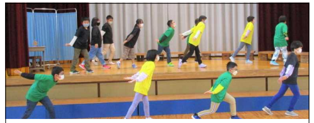
3・4年生の練習ダンスだけではなさそうです！

10月29日（土）本番の令和4年度学習発表会テーマは『絆～みんな かがやけ 感動のステージ～』です。当日は、30人全員が力を合わせて、とびっきりの笑顔と大きな感動を届けてくれるに違いありません。楽しみにご来場下さい。また、子どもたちは、全員が自分のめあてをもって本番を迎えます。それをご家庭でも共有し、応援と励ましの声をかけていただければありがたいです。