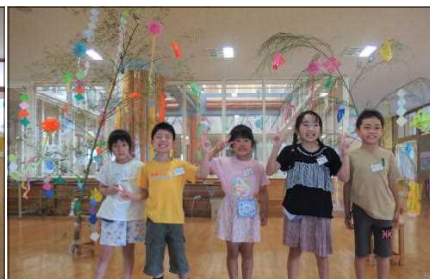
七夕飾り！きれいにできました

さて、みんなが楽しみにしている夏休みが、いよいよ明日から始まります。夏は子どもたちが逞しく成長する季節ですが、気持ちが開放的になることもあり、事故や事件に巻き込まれる危険性が高まる時でもあります。交通事故や水難事故の防止、不審者への注意、熱中症やコロナ感染症予防、自然災害やクマ出没への備え等、注意事項は多岐に渡りますが、家庭や地域でのご指導、声掛けをよろしくお願いします。