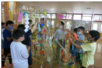
願いを込めて短冊を飾ります

7月6日（水）、今年も本校2階ホールに七夕飾りが登場。2年生が七夕集会を行った後で、全校児童が願いを書いた短冊を飾り付けました。「料理が上手になれるように」「漢字を全部おぼえたい」「ウクライナの平和がもどりますように」「コロナがなくなるように」「家族が長生きするように」など、素直に自分の思いを表現していました。