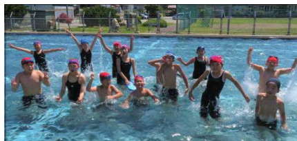
水泳練習楽しんでやりました

さて、みんなが楽しみにしている夏休みが、いよいよ明日から始まります。夏は子どもたちが逞しく成長する季節ですが、気持ちが開放的になることもあり、事故や事件に巻き込まれる危険性が高まる時でもあります。交通事故や水難事故の防止、不審者への注意、熱中症やコロナ感染症予防、自然災害やクマ出没への備え等、注意事項は多岐に渡りますが、家庭や地域でのご指導、声掛けをよろしくお願いします。