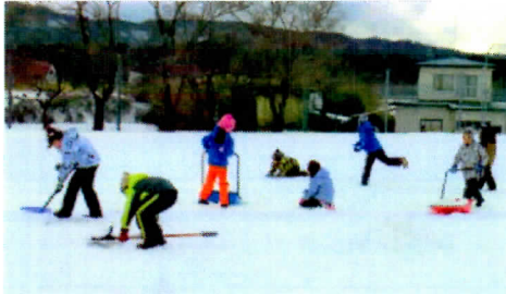
1・2年生は寒さに負けずに雪遊び

メッセージは教室で子どもたちも読んでいます。達成感が高まっていくので、毎年のお楽しみにもなっています。