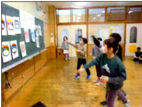
2/2 1・2年生 「豆まき集会」心の鬼を追い払おう!