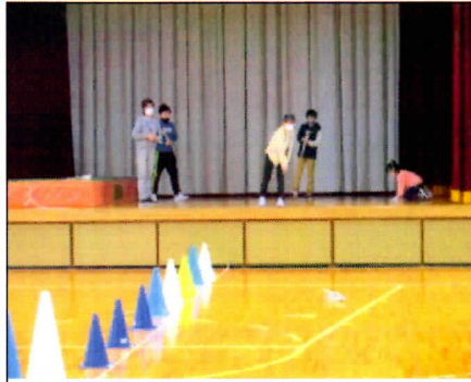
2/8 第2回縦割り班レク ゲームで楽しく協力しました