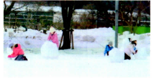
大きな雪だるまの制作中！