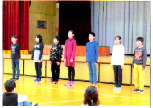
2/17 全校音読集会 4年生「ふくらはぎ」の発表!