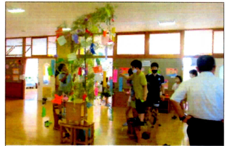
星に願いを！七夕飾り

普段なかなかできないことにじっくり取り組んだり、家族や親族の方々と触れ合う時間を多くとったりと、長い夏休みを安全で有意義に過ごし、8月23日（月）、一回り成長した姿を見せてほしいと思います。