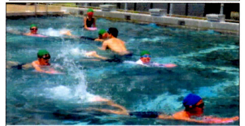
水泳練習がんばりました！