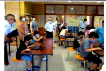
(第2回学校運営協議会・授業参観)

なお、ラジオ体操は各家庭で行うところがほとんどですが、お子さんたちと一緒に朝涼しいうちの体操を一緒にやってみてはいかがでしょうか。