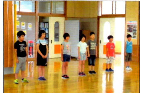
音読集会 密を避け、2・3、5・6年は3階で広がって堂々と発表 7/14