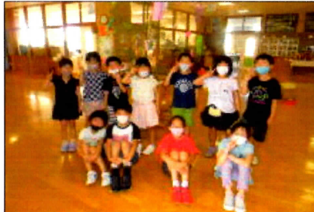
「1・2年生七夕集会」短冊に願いを込めて(2年生がリードしました) 7/7