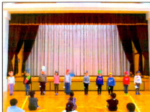
2/19 全校音読集会 2年生「たんぼぼ」の発表!