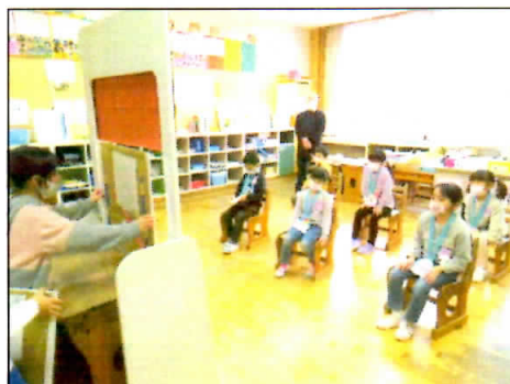
2/2 年長さんとの交流会 「たぬきの糸車」の読み聞かせ中!