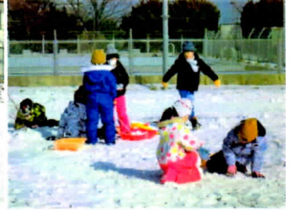
1・2年生は寒さに負けません！ 雪が積もるとみんなニコニコ！

さて、2月12日（金）には、真山神社においてなまはげ柴灯まつりが行われました。例年であれば、本校の3年生が「なまはげの由来」等の発表をしていたのですが、今年度は感染予防のため現地での発表は行いませんでした。そのかわりに、校内での発表の様子を収録したDVD、手作りなまはげパンフレット、なまはげマスコットを提供させていただきました。そのなまはげパンフレットに対して、今年もまた各地からメッセージが届いています。その一部を紹介します。メッセージは教室に掲示し、子どもたちに読ませています。やりがいや達成感が高まっていくので、とてもありがたく思っています。