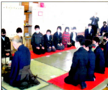
2/5 男鹿北中お茶会 6年生が参加しました