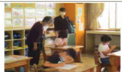
（第2回学校運営協議会・授業参観）

なお、ラジオ体操は各家庭で行うところがほとんどですが、お子さんたちと一緒に朝涼しいうちの体操を一緒にやってみてはいかがでしょうか。