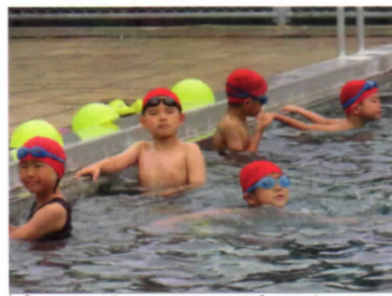
プールでもソーシャルディスタンスに気を付けてます(2年生)

このような不安もあるわけですが、子どもたちにとっては何と云っても楽しい期間となるでしょう。普段なかなかできないことにじっくり取り組んだり、家族や親族の方々と触れ合う時間を多くとったりと夏休みを有意義に過ごし、8月24日(月)、一回り成長した姿を見せてほしいと思います。