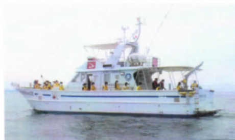
SEA級グルメスタジアム 海洋高校実習船「なまはげ」で海のごみ調査(4~6年)