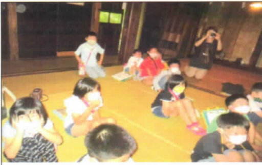
1・2年生 校外学習（男鹿水族館GAO、なまはげ館・・・いい子にしています）7/7