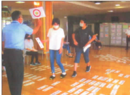
今年度初めてのPTA授業参観 7/10