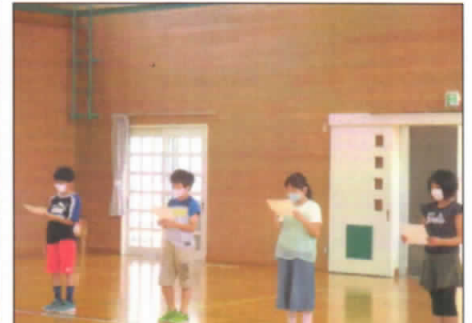
音読集会 密を避け、3～6年は体育館で広がって堂々と発表 7/15