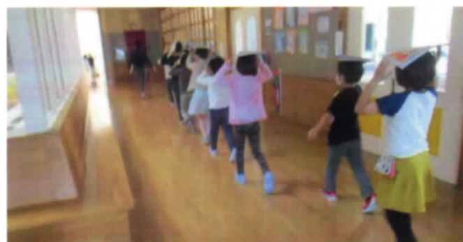
「お・か・し・も」を守り、落ち着いて避難！

訓練終了後の「振り返り」（グラフ及びコメント参照）から、子どもたちが真剣に訓練に参加したことが分かります。