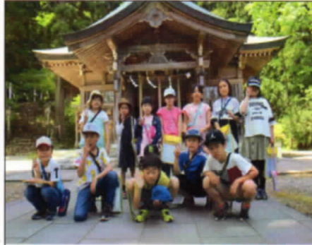
6/5 「五社堂見学」なまはげ伝説は ここから生まれたんだね。(3・4年生)