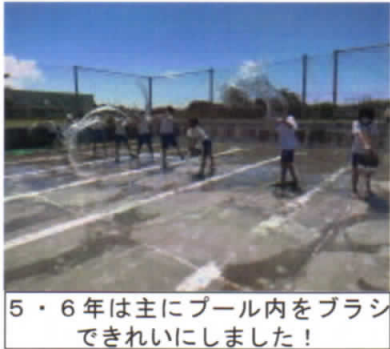
5・6年は主にプール内をブラシ きれいにしました!