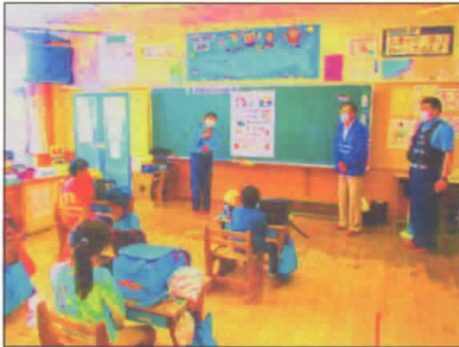
6/5 「いかのおすしファイル」贈呈式で、 防犯意識を高めました。(1年生)