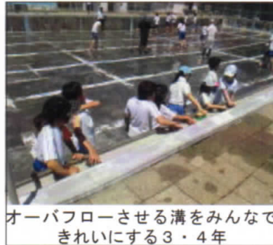
オーバフローさせる溝をみんなで きれいにする3・4年

6月11日に3～6年生できれいに掃除してくれたプールに満々と水が入り、今年度も水泳学習のシーズンがやってきました。今後、本校では文科省から出されているガイドを基に、感染予防を考慮しつつ熱中症対策もとりながら、安全な水泳学習を行っていく予定です。