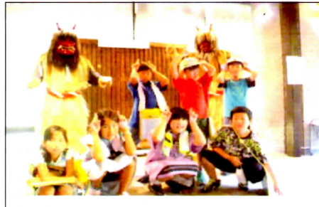
3年校外学習 なまはげ館 9/3