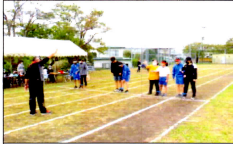
9/26運動会 5・6年親子競技 「運命の親子二人三脚」