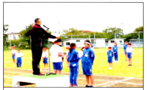
9/26運動会 優勝は赤組！白組も がんばりました！