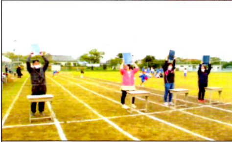
9/26運動会 3・4年親子競技 「気の合う親子」