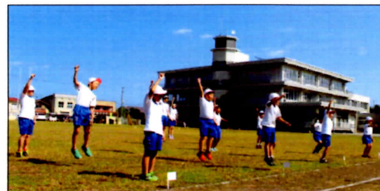
応援パフォーマンスの練習風景です

子どもたちにはこれまでの学習を振り返り、よくできたことと課題となることを整理し、後期に向けた目標をしっかりとってほしいと思います。なお、今年度の通知表は、新学習指導要領の実施に伴い、各教科の「学習のめあて」の項目が「知識・技能」「思考・判断・表現力等」「学びに向かう力・人間性等」の3観点に分類、整理された形になっています。詳しくは、通知表と一緒に配布される「通知表の見方」をご参照ください。保護者の皆さんにも、引き続き、ご指導よろしくお願ひします。