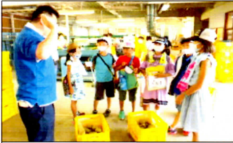
3年校外学習 男鹿梨選果場見 9/3