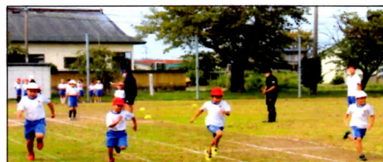
気分は本番と一緒に、徒競走練習