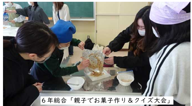
6年総合「親子でお菓子作り&クイズ大会」