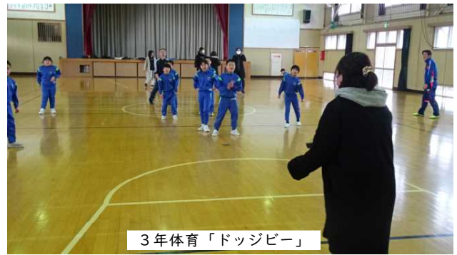
3年体育「ドッジビー」