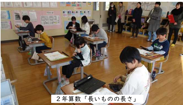
2年算数「長いものの長さ」