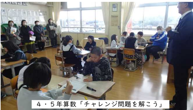
4・5年算数「チャレンジ問題を解こう」