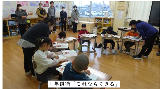
1年道徳「これならできる」

全体会と学級懇談は今回が最後ということになりますが、有意義な場となったことと思います。全体会で話したとおり、残りの期間弘戸小としてできることに全力を尽くし、統合と進学に向かいたいと思います。最後までどうぞよろしくお願いたします。