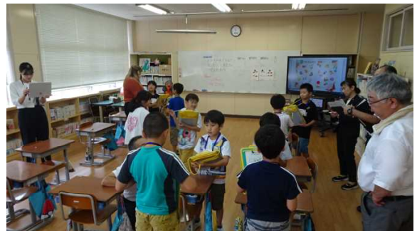
3年生の外国語活動。次々とペアを替えながら、好きなスポーツ、食べ物、色を尋ねたり答えたりしている。