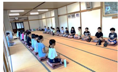
【坐禅：調身・調息・調心】