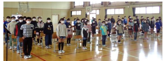
【久しぶりの歌声 校歌斉唱♪】

「心すなおに 勤労の汗をよろこび ともどもに 力をあわせ 励もうよ(3番の歌詞)」と、こんな素敵な歌詞をメロディーに乗せて歌うだけでも歌う人の心により効果が染み渡るように思います。