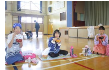
【下ごしらえの様子】 【体育館で、輪になって“いただきます”】 【うーん、おいしい！】