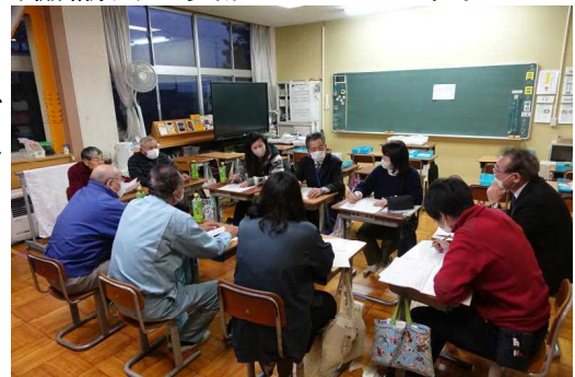
< 12/8 教育環境部会 >