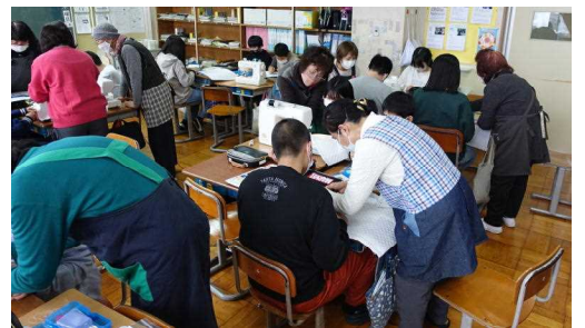
< 11/30 家庭科ミシン補助 >