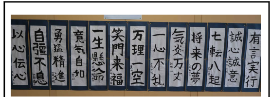
6年生一人一人の座右の銘です！