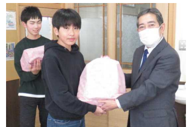
★寄贈図書を受け取る図書委員