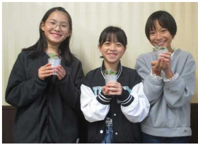
★春日井市の花「サポテン」を手に！

昨年秋に行われた春日井市交流学習会の感想文集『春日井の思い出』が届きました。本校からは3人の6年生が参加しました。学校報では感想文の一部を紹介します。