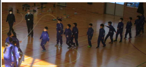
★長縄8の字とびの記録更新中!?(3年生)

前跳びやチャレンジ跳びに続き、学年ごとに長縄8の字跳びの記録に挑戦しました。体調