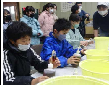
★しよつづの瓶詰めを体験中!

5年生では総合的な学習で、男鹿の海の恵み(海産物資源・伝統食)をテーマに学習を進めてきています。今回は、(株)諸井醸造で、