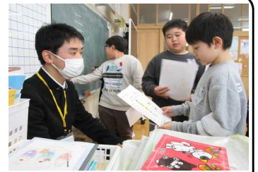
★九九の暗唱をチェック中！

春からの進路が決まった高校3年生(本校卒)が、高校生助手として10日間、後輩たちの学習・生活の支援に当たってくれました。