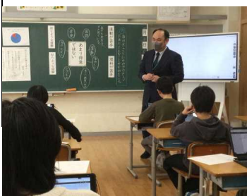
★4年松組 道徳科の授業

ラクターや憧れる言動に着目して手本にするという観点で、子どもが自分の夢や想いを伝えるための劇のアイデアを考える活動を重視しました。後日、親御さんや家族には劇を見ていただくことができました。