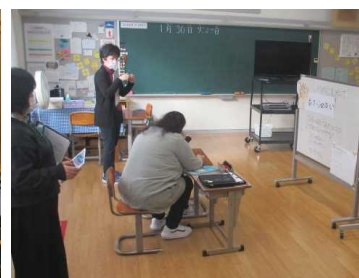
★1年桃組 自立活動の授業