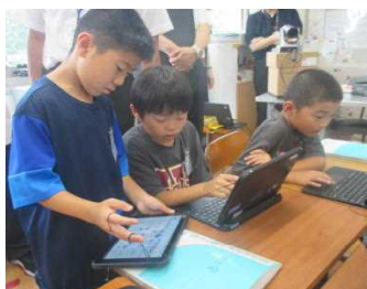
★タブレットで意見交流 (R5.3年社会科)

令和3年度から県教育委員会の指定を受けて実践研究を進めてきた上記事業の最終年度。児童の意識変化についてお知らせします。