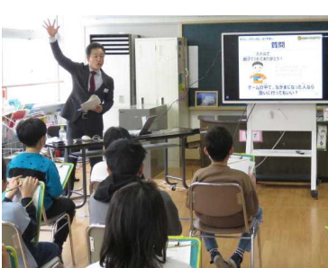
★聴講する高学年の子どもたち

SNSを含むインターネットは便利ですが、使い方を誤ると、事故・事件の被害者や加害者になってしまう危険がともなうものです。今回、高学年部では、総務省東北総合通信局から講師をお招きし、ネットの安全利用について学ぶ機会をもちました。