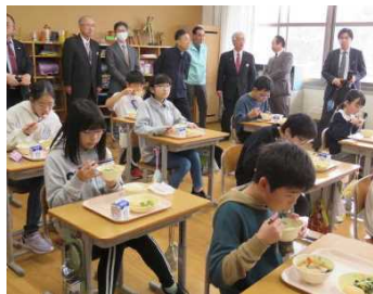
★「おいしかったよ、秋田おでん！」

総合的な学習で、男鹿の海の恵みをテーマに学習を進めている5年生の教室では、ひと箸ごとに「美味しい！」と呟きながら食べていました。一般の市民より「一口」お先に食べられたことにも満足げの様子でした。