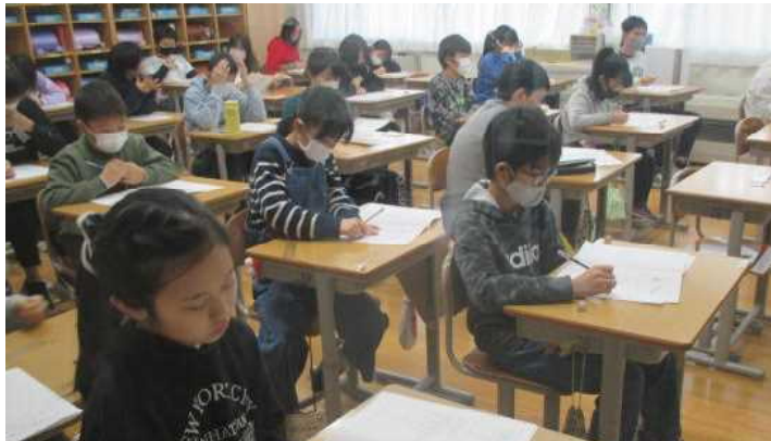
★県学習状況調査に真剣に取り組む6年生

令和5年12月実施の「秋田県学習状況調査」の結果をお知らせします。この調査は、4～6年生を対象に、国語・社会(4年生は除く)・算数・理科の学習内容の定着度や学習への興味・関心、学習習慣、生活習慣等について調査し、指導工夫・改善につなげるものです。今後とも、明らかになった各学年、各教科の課題から未定着の学習内容を補充するとともに、授業改善を進めていきます。