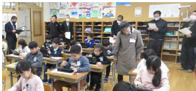
★委員の皆さんによる授業参観(2年算数科)