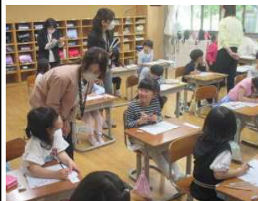
★「見て見て、勉強は楽しいよ！」

卒園した子どもたちが円滑に学校の生活リズムをつかみ、様々な活動に取り組めるよう、幼・保・小相互の連携を大切にしています。5月には船川保育園の先生方による授業参観がありました。6月には、授業研究会にも参加していただき、本校の取組を見ていただきました。