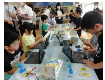
★4年松組 理科の授業