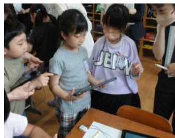
★2年松組 生活科の授業

いずれの授業でも、友達の探検・実験の結果や考え等を自由に見合って質問したり、自分で確かめたりする主体的な姿が見られました。今後、子どもの気付きや学びの質をより高められるよう、子どもが自分の学びを振り返る活動も大切にして授業づくりを進めていきます。