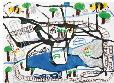
ぐるぐるせんろの町