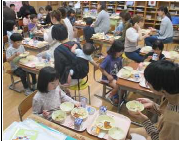
★「おいしい給食だね！」

4年ぶりの1年生親子給食試食会には、16名の保護者の皆様の参加がありました。この会では、南部調理場の栄養教諭をお招きし、学校給食のねらいや、学齢期と食生活の大切さなどについても講話をしていただきました。