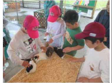
★モルモットと触れ合う子どもたち

秋田市の大森山動物園(ミルヴェ)に出かけてきました。あいにくの雨模様となりましたが、グループになって楽しく園内を歩き周り、ライオンやゾウ、キリン、ペンギンなど、たくさんの動物と会ってきました。ふれあい広場では、飼育員さんの説明を受けてから、かわいいモルモットを抱っこしたり亀の甲羅や鹿の角を触ったりして、温かい気持ちになりました。