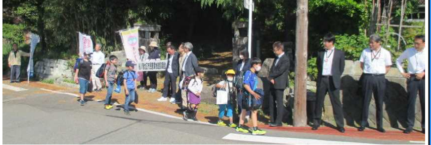
★登校時、旧中川邸入口(泉台区)付近で行われた「あいさつ運動」の様子

男鹿市では、今年度も、各地区の公民館を拠点として、「3つの市民運動」(読書運動、あいさつ運動、体力づくり運動)を推進しています。船一小学区では、6月5日の登校時、泉台区町内の旧中川邸入口付近で「あいさつ運動」が行われました。船川港地区市民憲章推進協議会や、船川港公民館、市職員の方々が、元浜町方面と市役所方面から歩いて来る登校班の子どもたちにも、「おはようございます」と声をかけました。この運動には、地域の子どもたちを見守り、互いに挨拶がかわされる明るい街づくりをすすめるという願いが込められています。子どもたちからも、元気で明るい挨拶がたくさん返ってきていました。挨拶は、社会や人間関係の潤滑油に例えられます。各家庭でも、子どもたちの挨拶が習慣化されるよう、ご家族の皆様のご協力をお願いいたします。