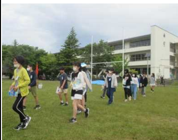
★校舎から、グラウンドへ1次避難

日本海中部地震(秋田沖地震)から40年目になりました。子どもたちは勿論のこと、当時の様子を知らない若手・中堅教員も増えてきました。5月26日の県民防災の日に合わせて、避難訓練を行いました。