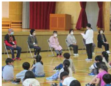
★「1年間、よろしくお願ひします。」

スクールボランティアの皆さんを迎える「こんにちは集会」を開きました。当日は、クラブ活動で講師をしてくださる皆さんが参加してくださいました。本校では、クラブ活動や登下校の見守り、学習支援、図書の本の整理、昔語り・読み聞かせ、生け花飾りなどで、たくさんの方々のお世話になっています。ありがとうございます。今年度も、よろしくお願ひいたします。