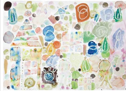
プレゼントをさがせ