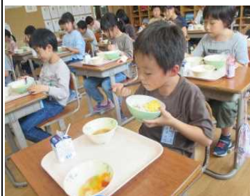
★もりもり、パクパク、「おー、うまい！」

男鹿産の天然真鯛のしょっつる味そぼろ丼が献立でした。真鯛は台島大謀、しょっつるは諸井醸造からの提供で、海洋高校の生徒が加工し、南部調理場で調理されたものです。感謝しながら、男鹿の恵みをいただきました。