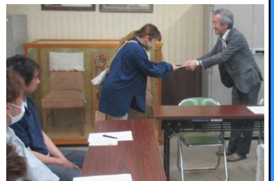
★スポ少への助成金の贈呈の様子