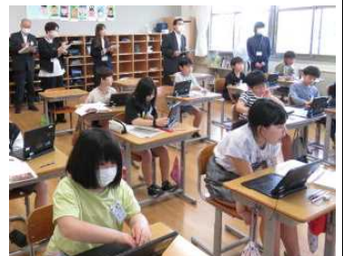
★4年国語科の授業を参観の様子

男鹿市教育委員による学校訪問がありました。来校された皆様には、校内一巡と全学級の授業を参観していただき、本校の教育環境や学習に取り組む子どもたちの様子、学習・生活指導に当たる教職員の様子などを見ていただきました。懇談会では、落ち着いた意欲的に学ぶ子どもたちと授業づくりなどに励む教職員たちにお褒めの言葉をいただきました。