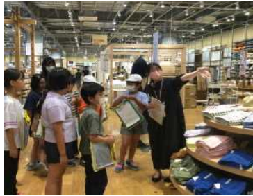
★無印良品で説明を受ける子どもたち

男鹿市内の事業所を巡る社会科見学に出かけてきました。秋田プライウッド(株)男鹿工場、いとく男鹿ショッピングセンター、無印良品、オガーレでは、初めて見るもの、改めてじっくり見るもの、出先の方々から教えていただいたことなど、新たな発見があり、さらに調べてみたい疑問もたくさん生まれました。これからは社会科学習で疑問を解決していく3年生です。