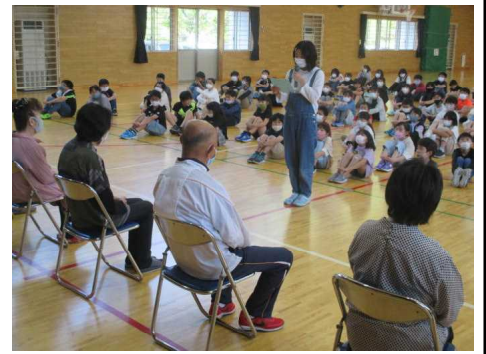
★歓迎の代表挨拶をする6年〇〇〇〇さん