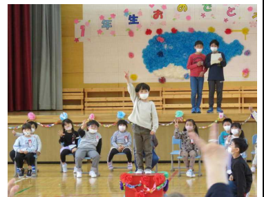
★1年生おめでとう集会の様子から

全校児童は141名になりました。これから、全校縦割りなかよし班活動等でも交流を深めていくことになっています。