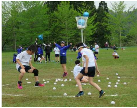
★「ダンシング玉入れ」競技(6年)から