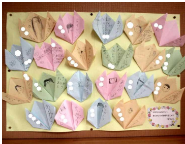
★ありがとうのメッセージ

6年教室に心温まる「ありがとうメッセージ」が掲示されていました。21個のハート型の折り紙一つ一つに、感謝の言葉が綴られています。これは、1年生の子どもたちから、児童会行事「1年生おめでとう集会」の企画・運営をしてくれた6年生に贈られた「ありがとうメッセージ」でした。集会後も心の交流が続いていました。「どういたしまして、私たちが楽しかったよ。」