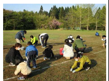
★親子でグラウンド整備中です。

早朝、6時から7時までの1時間、総勢70人弱の人手でトラック内の草取りやフィールド内の草刈り、側溝の泥上げに汗を流しました。おかげさまで、整ったグラウンド環境の中で、運動会練習や運動会当日を迎えることができました。ありがとうございました。