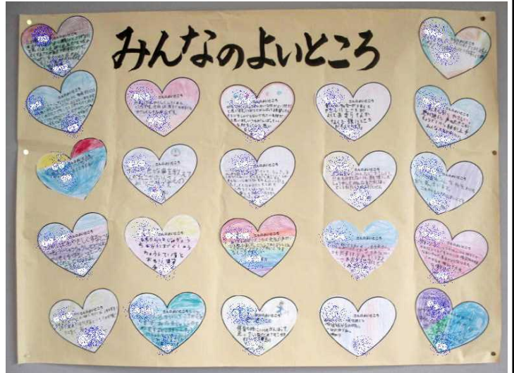
★お互いによいところを認め合う活動 (4年教室掲示から)

毎日一緒に学校生活を送るクラスメイト。子ども一人一人にキラリと輝くよさがあり、それらを認め合うところから新年度の学級開きが始められています。仲間から「プラスの承認」を受けて嫌だと思ふ人は、子どもでも大人でもないものです。学級の絆づくりと居場所づくりでも大切なことであり、自己有用感や自己肯定感の醸成にもつながっています。