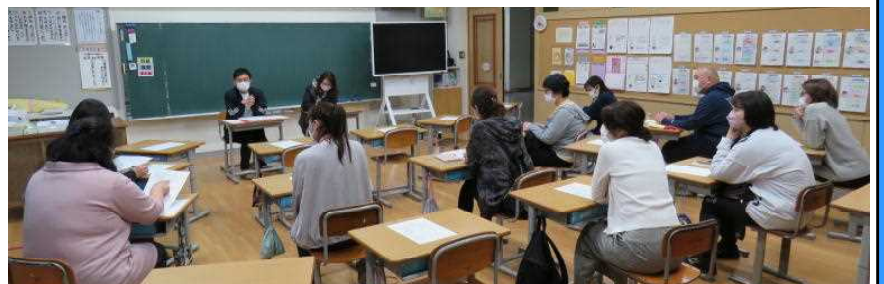
★今年度の活動計画について協議する専門部会（総務部会の様子から）

4月の新型コロナウイルス感染症の感染状況を踏まえ、PTA授業参観や総会、学級懇談が中止となりました。総会については、書面審議で行われ、昨年度の会務報告・決算報告や今年度の事業計画案・予算案、役員人事案等が、原案通り承認されました。