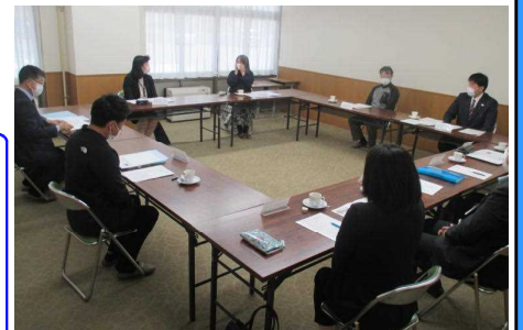
★第1回学校運営協議会の様子から