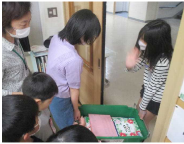
★教室に配達する5年図書委員

男鹿市立図書館から定期的に本の貸し出しを受け、読書活動に利用しています。学校の図書室にもたくさんの蔵書がありますが、市立図書館の司書さんお薦めの本は、どれも子どもたちに大人気で、新しい本が届くのを心待ちにしています。今回、コンテナに入って届いた本は、5年生の図書委員によって教室に配達されました。早速子どもたちが集まり興味津々でした。