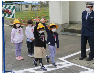
★「信号も、車も確かめるよ。」

男鹿署の方を講師に、低・中・高学団ごとに交通安全教室を開き、安全な歩行や自転車の乗り方、交通安全ルールについて確認しました。県外では、自転車による加害責任が問われる事例も発生しています。小学生でも安全運転は欠かせません。