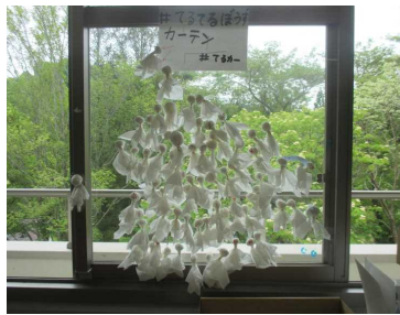
★「5/14に運動会ができますように！」

各学年の教室や廊下の至る所に、てるてる坊主が「出現」しました。その中でも、6年教室には、「てるてるぼうずカーテン」や「てるてるぼうずの森」なるアート作品のようなものまで製作され圧巻でした。