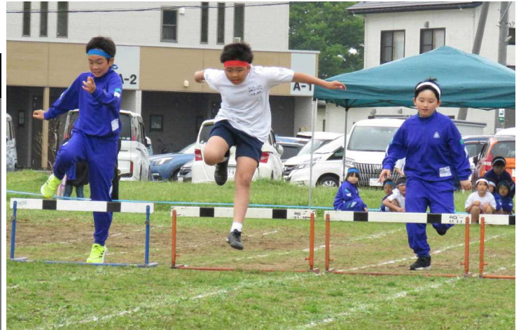
★スタートダッシュのハードル越え…運動会・障害物競走(5年)

▶「鳥海山が見えると、雨になる。」必ずしも当たるわけではありませんが、男鹿でも聞かれる天気予報の言い伝えです。今では、気象観測技術の進歩で詳細な予報が公的機関や民間企業から提供され、先月の運動会実施には、天気予報サイトの情報を複数集め、開催判断の材料の一つとして利用しました▶霧雨の中での始まりでしたが、後半には少し日も差し、競技や係活動に全力で取り組む子どもたちの熱気や、子どもたちの作ったてるてる坊主の効果(2面に関連記事)が、天気の回復に一役買っていたのかも知れません。多くの皆様にご参観、ご声援をいただきありがとうございました。子どもたちも頑張りがいがあったことと思います▶学校には、運動会、学習発表会、なべっこ、修学旅行などの多くの学校行事があります。どの行事も子どもたちが大きく成長し、学校全体、学年・学級をも大きく成長させる機会であると捉えています。一人一人を生かした役割や活躍できる場面、互いに力を合わせて協働し合う場面での取組を通して、子どもたちが自分たちでできた実感することで自己有用感や成就感、所属感、連帯感も高まります。また、学年が上がるにつれて、自分たちで考え、主体的に取り組む子どもへと成長していきます▶今回の運動会では、練習時を含め、競技への一生懸命な取組や精一杯の声援、高学年の献身的な係活動への取組などから、努力してきた価値ある子どもの姿を見ることができました。後日、各学年・学級では、これまでの頑張りを相互評価して称え合うとともに、一人一人が自分の取組を振り返って自己評価し、今後の活動への目標を立て始めています。