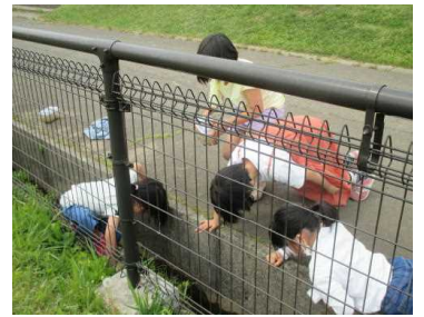
★「いるよ。いるよ。いっぱいいるよ。」

休み時間、虫かごを抱えながらグラウンド脇の側溝に繰り出す子どもたちの何と多かったこと。お目当ては、「オタマジャクシ(御玉杓子)」です。早朝親子グラウンド整備作業の際に泥上げをした側溝に残っていた蛙の卵が孵化したものです。捕まえたオタマジャクシは、教室や家に運ばれ、観察中のものもあるようです。「もう外にカエル！」とい出すのでは…。