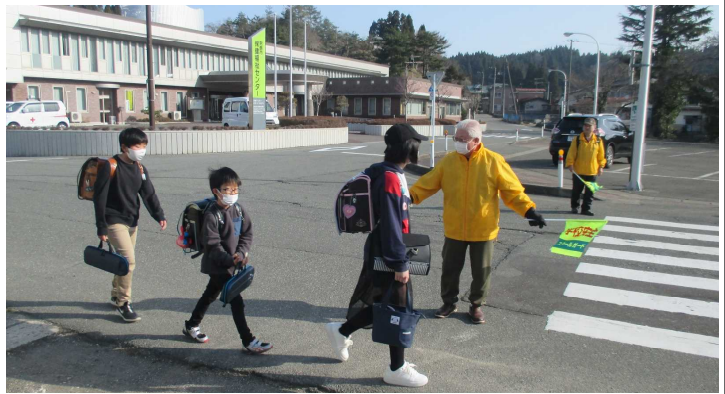
★市保健センター前で、登校を見守る「くじらっこ見守り隊員」のみなさん

お願い ★学校から下金川地区に続く市道は大変狭くカーブの多い道路です。朝の時間帯を除き、通行許可規制はかかっていますが、子どもたちが登下校時通る所です。事故防止の観点から児童クラブの送迎時も含め、泉台地区側の市道の利用をお願いします。