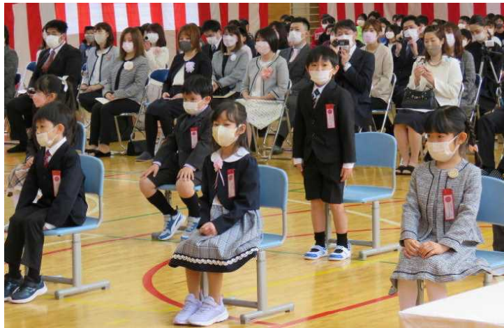
★入学式での氏名点呼の様子から…明るく答える1年生たち

▶春爛漫の時となり、校舎向かいの通称「くじら山」のヤマザクラは淡い桃色を付け、他の木々たちの濃淡のある新緑も映える季節を迎えています。先日、学区内の家屋の庭先で、鯉のぼりが、五月晴れの空に元気よく泳ぐ様子を見かけました。随分見かけることも少なくなった端午の節句の風物詩に、我が子や我が孫、ふるさと男鹿の子どもたちの健やかな成長を願う心を感じずにはられませんでした▶先月、本校では、2年ぶりに全ての学年が参加する入学式を行い、21名の1年生が入学しました。入学式での学級担任の氏名点呼に明るいうえで答えたり、礼儀正しく話に聞き入ったりしている姿からは、新しい学校生活への期待がたくさん伝わってきました。また、満面の笑顔で小さな背に大きなランドセルを背負って登校する姿は、微笑ましいもので、ご家族の慈しみがそのまま花開いたかのように見えています。一日も早く学校生活のリズムに慣れ、思う存分学習に、遊びに取り組んでほしいと思います▶新生を迎え、学校全体が一段と明るく元気な雰囲気になっています。また、子どもたちは、それぞれの学年・学級で一年間を見通した学年・学級目標や一人一人の目標に向かって、取り組み始めています。わたしたち教職員も、子どもたちの目標や夢の実現に向けて、細心の指導・支援にあたっていきたくと思います。今年度も、ご家庭や地域の皆様からのご支援とご協力をよろしく願います。