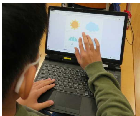
★タブレットPCに、こころの天気を入力する6年生

文部科学省のGIGAスクール構想事業を受け、秋田県教育委員会では昨年度から上記事業を進めています。そして、本校を含めた県内の小・中学校6校(*)が、令和5年度までの3年間、実践的研究推進校として指定を受け、各校においてICTの効果的な活用を通じた授業改善に取り組んでいます。今年度と来年度は、研究の成果を広く公開する年度となっており、11月には公開授業研究会の開催を予定しています。