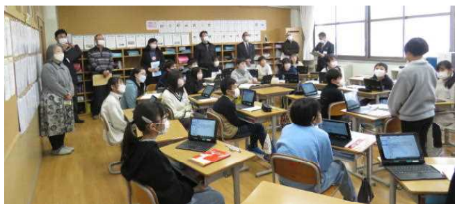
★委員の皆さんによる授業参観(5年道徳科)!