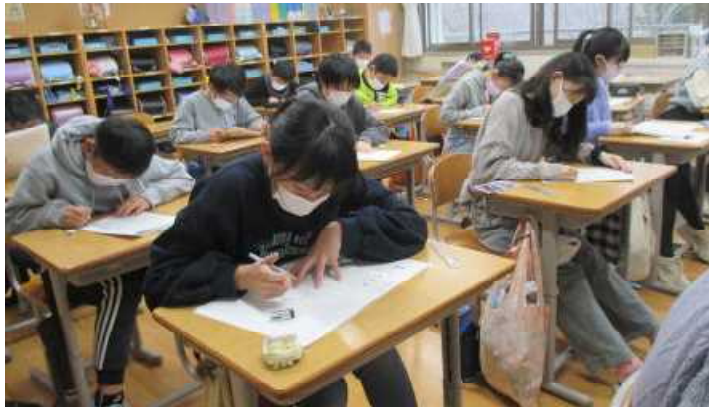
★県学習状況調査に臨む6年生！

令和4年12月実施の「秋田県学習状況調査」の結果をお知らせします。この調査は、4～6年生を対象に、国語・社会（4年生は除く）・算数・理科の学習内容の定着度や学習への興味・関心、学習習慣、生活習慣等について調査し、指導工夫・改善につなげるものです。今後とも、明らかになった各学年、各教科の課題から未定着の学習内容を補充するとともに、授業改善を進めていきます。