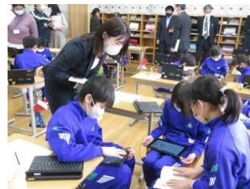
★4年松組 道徳科の授業