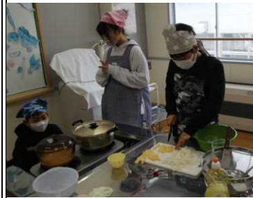
★炊飯と味噌汁の調理中！

5年生では、家庭科の調理実習がありました。今回は、ガラス鍋を使っての炊飯と煮干しでだしをとった味噌汁の調理に挑戦しました。炊飯では、ガラス鍋を使ったので、火加減が難しかったようです。普段見えない電気・ガス炊飯器の中で起こる沸騰の様子も観察することができ、ぶくぶく泡立つ様子に驚いていました。味噌汁は、煮干しで丁寧にだしを取り、味噌を入れるタイミングもバッチリでおいしく仕上がりました。