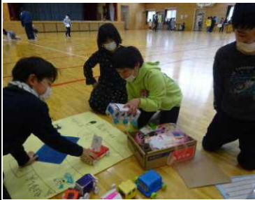
★楽しいおもちゃ遊びに夢中！

2年生が「おもちゃまつり」を開きました。これは、生活科「うごくうごく わたしのおもちゃ」の学習として行われました。手作りおもちゃの材料は、乳酸飲料の容器や割り箸、紙コップ、輪ゴムなど、身近にある物です。グループごとの「おもちゃ屋」の店頭では、2年生による呼び込みや遊び方を丁寧に教える姿が見られました。招待された1年生も、お兄さん、お姉さんたちのお陰で楽しい一時を過ごすことができました。