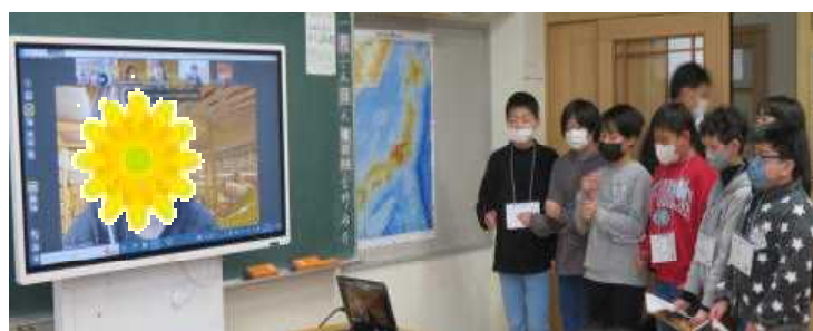
★(画像を一部加工) AIUの学生とオンラインで会話をしている6年生

ZoomやMicrosoft Teamsなどのオンライン会議ツールを活用すると、遠隔地にいる人ともライブで顔を見合わせて、会話や必要な情報(資料、画像、動画など)のやり取りをすることができます。先日、高学年の外国語科学習「Let's enjoy English conversation!～英会話を楽しく!～/Let's get to know different cultures!～異文化を知ろう!～」では、Zoomを活用して国際教養大学(AIU)の学生とのオンライン交流会をしました。留学生や日本人学生と英語で会話をしたり、留学生との会話を通して、異文化に触れたりすることができました。学生たちによる自己紹介(出身国の言語、料理、位置・気候なども)の後、子どもたちから「好きな食べ物は何?」「好きなアニメは何?」などの質問や感想を発表しました。さらに、子どもたちは、男鹿や秋田の行事や特産品、名物などについて紹介しました。