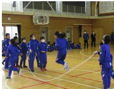
★長縄とびの記録更新中!?

冬期の体力づくりも兼ねて、体育科の学習や休み時間には、なわとび運動を取り入れてきました。その集大成の場となるのが、なわとび集会です。どの学年も練習を積み重ね、本番の前跳びやチャレンジ跳びなどに臨みました。