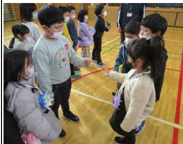
★1年と交流する保育園児!

令和5年度入学予定児童の体験入学と保護者への入学説明会を行いました。コロナ下、今回のような参集型の開催は、2年ぶりとなりました。