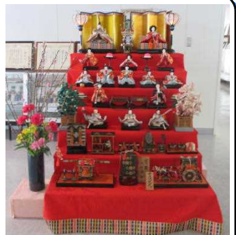
★継承されているひな人形