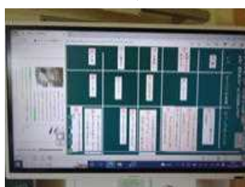
★電子黒板に映し出された「マイ黒板」

デジタル教科書の本文から、言葉や文章をドラッグして抜き出し、「マイ黒板」に整理してまとめました。紙の学習シートと異なり、間違いを直し易い点や要点を短冊にして整理し易い点、整理した画面をもとに友達との話し合いが容易な点などにICTやデジタルの有用さを感じました。ただ、タブレットPCの画面で「マイ黒板」の占める割合が大きく、デジタル教科書の本文の読みづらさが生じた子どもも見受けられました。その場合、従来の紙冊子の教科書を併用しながら、整理・まとめていくようにしました。