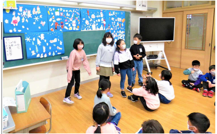
★学年活動「お楽しみ会」…共同制作した冬の風景を背に

*昭和4年4月に創刊、昭和5年11月から「半島新報」、戦後の昭和29年10月に復刊後は「男鹿半島新報」の名称で昭和33年頃まで刊行された地域新聞。その復刻版の一部が、『男鹿市の文化財第17集』(2011年、男鹿市教育委員会)に収められています。