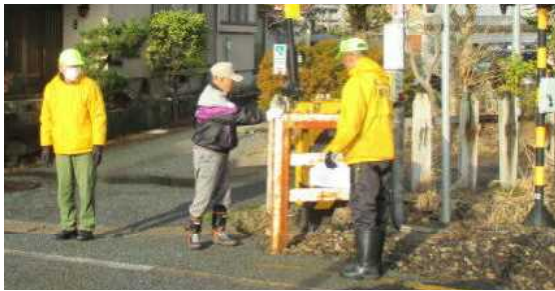
★下金川地区の下金川踏切付近にて

冬休み明け前に、学校とPTA 校外生活指導部、くじっこ見守り隊の皆さんと一緒に主要な通学路の点検を行いました。学校を起点に、下金川から上金川、比詰餅ヶ沢までのコースと住吉町から曙町、緑ヶ丘までのコースに分かれました。積雪の少ない状況でしたが、例年、除雪車による除排雪が多く積もる所や滑りやすい所などを確認しながら進めました。さらに、別の日には、下金川地区の見守り隊員の皆様による、県道脇の通学路、行っただけ、近を中心とした点検を行いました。ありがとうございました。保護者、地域の皆様には、今後とも安全な登下校のためにご協力をお願いいたします。◆見守り隊員や学校ボランティアの方々から、子どもたちに多くの年賀状をいただきました。ありがとうございました。