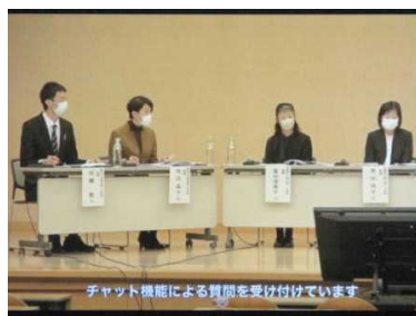
★会場でのパネルディスカッション