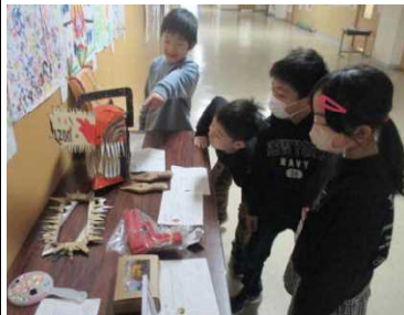
★冬休みの作品を鑑賞中！

学年ごとに冬休み期間中に子どもたちが制作した絵画や工作、手芸品などを紹介する「冬休み作品展」がありました。出品数は少なかったものの、どれもアイデアと感性豊かな力作・傑作ばかりでした。