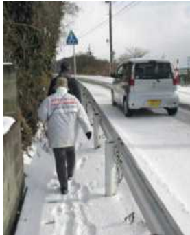
★県道脇の歩道にて