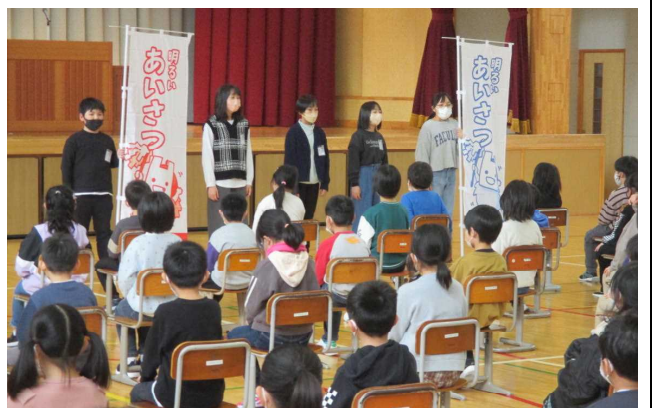
★集会の開始を告げる5年運営委員による「明るいあいさつ」

全校児童が一堂に会して、冬休み明け集会を開きました。児童会活動などの牽引役が6年生から5年生への移行期に入り、集会は5年生の運営委員によるお話を含めたあいさつから始まりました。年末に市役所からいただいた「明るいあいさつ運動」の「のぼり旗」を持ちながら、明るいあいさつの推進も全校にアピールしました。また、集会では、校長から子どもたちにいくつかの質問をしたところ、年末になまはげが来訪した家庭が昨年以上に多くありましたが、座敷まで上げた家庭は少なかったようです。また、いただいたお年玉で初売りに出かけた家庭が多かったようです。