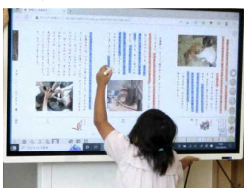
★デジタル教科書にマーカーしている様子

例えば、2年国語科『読んで考えたことを話そう「どうぶつ園のじゅうい」』では、獣医の仕事について書かれた教材文を読み、時間的な順序や事柄の順序などを考えながら、その内容の大体を捉えるために、表に整理してまとめていきました。その際、紙の学習シートを使わず、デジタル教科書内の「マイ黒板」という機能を活用しました。子どもたちは、筆者が、「いつ」「どんな動物に」「どんな仕事をするか」の視点で