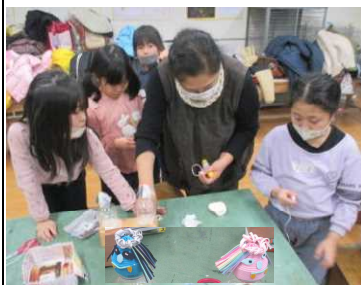
★なまはげストラップを制作中！

今年度も地域学校協働活動として、船一小放課後子ども講座「くじらっこ#148ラボ」が定期的に行われています。地域コーディネーターの○○○○さんを中心