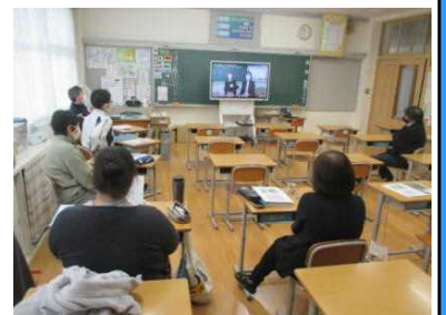
★校内から参加する教職員