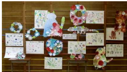
★ネイチャークラブ「葉っぱアート」