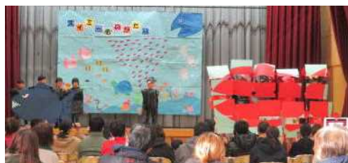
★2年 劇「スイミーものがたり」から