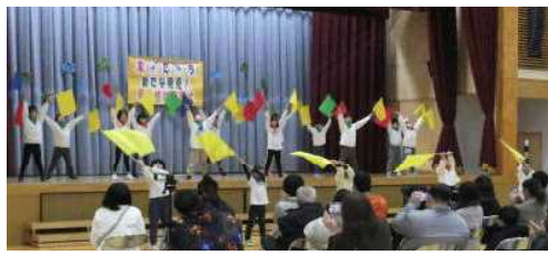
★3年 表現「友だちー～新たな発見!可能性は無限大～」から