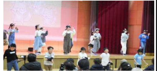
★4年 表現「音楽ショー ～つなげよう 22の心の輪～」から