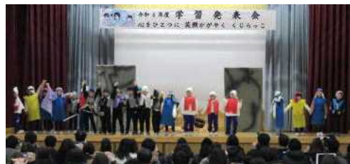
★1年 劇「アイウエオリババ」から

今年度は、11月上旬に公開授業研究会があり、例年より約1ヶ月遅い学習発表会の開催となりました。今年度も新型コロナウイルス感染症予防対策上、参観者数を制限しての開催となり、昨年度と比べ、完全入替の3部制から2部制になったものの、全学年の演目を全ての参観者にお見せすることができず、心苦しく思っております。それでも、子どもたちの舞台発表の様子やクラブ活動の制作品などから、これまでの学習の成果と成長を感じ取っていただけたいと思います。それぞれの学年で、それぞれのクラブ活動で工夫をこらし、協力し合いながら作り上げてきたものばかりでした。