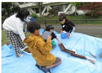
★5年…実験の様子を動画撮影している様子

4年「物のあたたまり方」の学習では、グループ実験(風船の中の空気を温めたり、冷やしたりして、体積の変化を調べる実験)の結果を画像で撮影しました。その後、授業支援ソフト「ジャストスマイル」ノートに一覧表示されたグループの結果を電子黒板で共有しました(下右画像)。さらに、みんなで、電子黒板に集約された画像を基に、体積の変化の様子はどうか、どのグループの結果が正しいのか、実験前に立てた予想や仮説と照らし合わせながら比較・検討していききました。前述の5年生の実験も同様ですが、これまで手書きの図表や絵図などで表してきた観察・実験の結果をタブレットPCを使って、デジタル化することができるようになりました。分かりやすく伝わり、考察する時間も多く取れるようになりました。