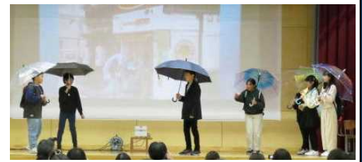
★6年 劇「わたしたちの6年間ー～成長の足跡～」から