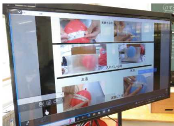
★4年…実験結果の画像を電子黒板で共有