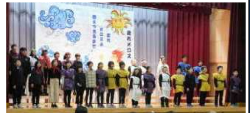
★5年 劇「走れメロス」から