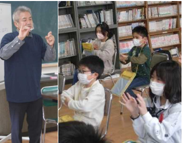
★講師の先生を真似て手話を練習中！

男鹿手話サークル「ぶりっこ」の方々をお招きして、手話やジェスチャーを通して交流を深めました。自分の名字や簡単な挨拶の手話を覚え、耳の不自由な人の生活を実際に体験しました。お手本の手話を見よう見真似で覚えようとしたり、授業後も覚えた手話を使ってみたりしていました。コミュニケーションをとる手段の一つとして、今後も活用してほしいですね。