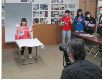
★卒業写真(個人)の撮影中！

「卒業アルバム」用の写真撮影が、さわき写真館さんによりすすめられています。クラス写真や児童委員会活動、クラブ活動の他、個人写真の撮影もありました。個人写真の撮影では、子どもたちが、思い出のグッズをもったり、ポーズを決めたりしながら笑顔でカメラに目を向けていました。卒業アルバムは、年明けの3月に完成します。どうぞお楽しみに！