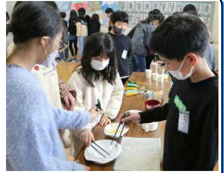
★5年生…手指の不自由な人も使いやすいように作られたユニバーサルデザインの「箸」で、コーン粒や角砂糖の模型をつまみながら、その使いやすさを体験中です！

本校では、障がいをもつ人たちの生活の様子やその人たちとの関わり方などについて学ぶ機会を設けてきました。今年度も、県立支援学校の先生方を講師にお招きして、学年ごとのテーマをもとに体験活動を取り入れた障がい理解教室を開きました。子どもたちは、社会で暮らす人たちの多様性を認め、尊重し合いながら生活していくこと大切さを学ぶことができました。