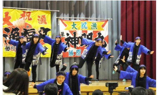
★学習発表会…5・6年生 踊り「勇魚(イサナ)」より

新しい年が明けました。日頃より、本校の教育活動には多くのご支援・ご協力をいただきありがとうございます。日々、子どもたちの活躍と成長が見られるのも、ご家族や地域の皆様方からのお力添えのおかげと感謝しております。本年もよろしく願いいたします ▶正月の料理に、「なます」を作るご家庭もあるかと思ひます。千切りにされた人参と大根の「紅白なます」には、平安や平和を願う心が込められ、祝い事の象徴である紅白の水引きをかたどっているという説もあります(大丸松坂屋HP)。鮭の氷頭と大根にイクラを添えた「氷頭なます」もまた、紅白の彩りからすると縁起物の料理かと想像がつかます。新しい年が穏やかで安らかな一年でありますように▶学習発表会がありました。高学年よる豊漁を願う踊り「勇魚」をはじめ、学年による劇・表現活動の素晴らしい舞台発表には、それぞれ希望や勇気、友情、協力、個性の伸長などのテーマがありました。それらを個々で、チームでどのように観客に伝えるか、子どもたちは悩みながらも、助け合って練習と工夫を重ねてきたものであり、本番までの取組の様子、雰囲気、空気感までも伝わってくるものでした▶全校や学年、学級で何かを創り上げていくとき、仲間とのチームワークの状況が、その仕上がりに大きく反映されます。日頃から一人一人に居場所があり、互いに切磋琢磨する中で絆づくりがなされ、落ち着き、居心地のよい集団であれば、自ずとチーム目標の達成に向けた取組も前向きになってくるものです▶さて、今、子どもたちは正月と冬休みの真っ只中。元気に過ごしているでしょうか。かつて、「おせちもいいけどカレーもね!」というテレビCMがありました。正月気分が抜ける頃、くじらっこの仲間が再び集う学校生活が待っています。「冬休みもいいけど学校もね!」