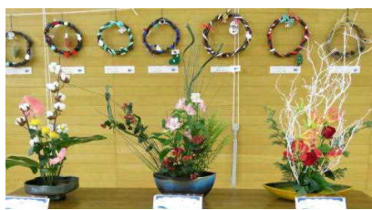
★家庭クラブ「リース」・和風クラブ「生け花」