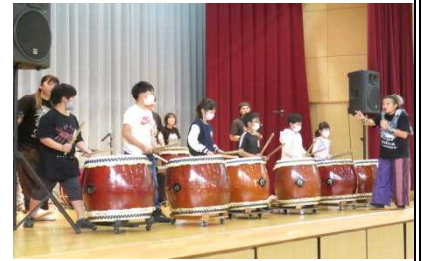
★ふれあい演奏を体験中の子どもたち

男鹿市を拠点に活動するなまはげ太鼓団体、「男鹿っ鼓」の演奏公演がありました。体育館いっぱいに響き渡る迫力ある演奏とパフォーマンスに体が震えるくらい感動していた子どもたちでした。集会では、同団体の子ども太鼓チーム「和(なごみ)」に所属する子どもによる演奏の他、12名の代表が実際に太鼓の演奏体験もし、芸術・文化の秋にぴったりなひと時になりました。