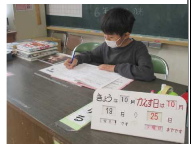
★本の貸出しをする図書委員

右写真の日は、ペアが休みで、一人で担当していました。月2回の活動日には本の整理や市立図書館からの貸出本の配達・回収もしています。