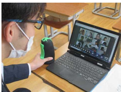
★オンライン朝の会で子どもたちに話しかける学級担任

タブレットPCには、Microsoft Office 365がインストールされており、Word、Excel、PowerPointの他、Microsoft Teams等の機能も充実し、活用しています。Teamsは、学校(教師)が管理者となり、チーム内(全校や学年)でチャットやオンライン会議、ファイルの管理等を行うことができるコミュニケーションツールです。コロナの感染拡大に伴い、オンラインで授業を行うことも想定しています。Teamsの使い方に教師も子どもも慣れるために、夏休み明けから、原則、週1回教室で短時間の「会議」を開き、上手に使えるようになってきました(1年生は10月から)。10月には、家庭に待機する子どもたちとのオンライン朝の会やTeamsで各教室と結んだ前学期終業式・後学期始業式を開催し、活用の利便性を痛感しました。*『Teams会議の進め方/子ども用』マニュアルが「おがっこポータルサイト」にアップされています。