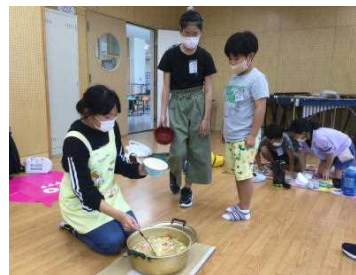
★「たくさん召し上がれ！」 下級生にたっぷり盛り付け！