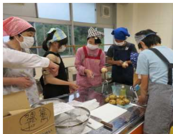
★「ジャガイモ90個。皮むくぞ！」 調理担当は精鋭の6年生！

来年こそは、野外での「なべっこ」をちょっとしたおしゃべりをしながらできたらと願っています。