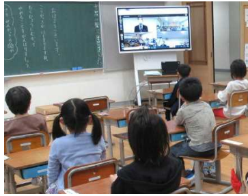
★学級での後学期始業式の様子

別室でカメラに向かって発表する子どもたちも普段と違う感覚で、少々緊張気味の様子でした。