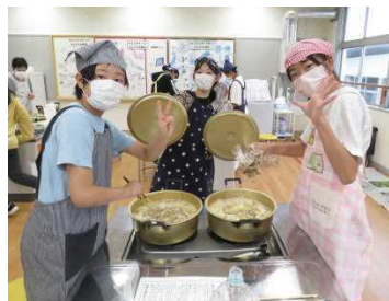
★「豚汁も完成間近だよ！」 最後においしさのおまじない！