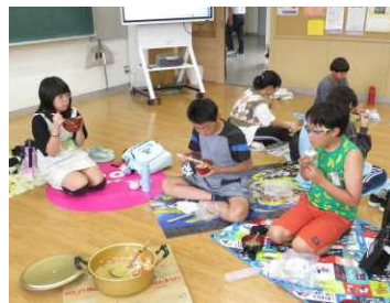
★「なんておいしいんでしょう！」 全ての班で見事に完食達成！