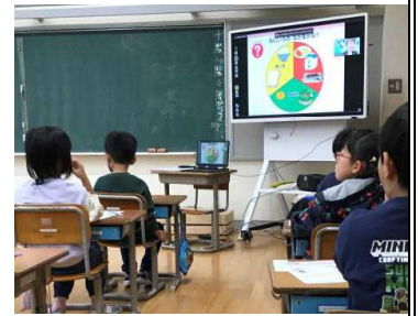
★今日の朝ごはん、何食べた？

株式会社明治の出前授業がオンラインでありました。「早寝・早起き・朝ごはん」とよく言われますが、このことによりどのようなよいことがあるのか、「脳」の働きや様子から分かりやすく教えていただきました。子どもたちは、バランスのよい食事だけでなく、よい生活習慣を身に付けることの大切さについても気付き、これからのめあてをもつことができました。