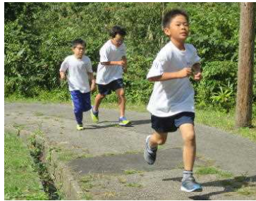
★住吉町側から最後の上り坂を力走中！