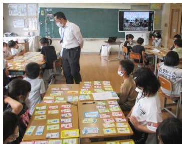
★防災カードゲームを通しての学び

4年生は社会科「自然災害(地震)からくらしを守る」で、災害時に家庭や学校、男鹿市や県ではどんな取組をしているのか学習しました。そして学んだことを基に県総合防災課の職員と、災害による様々なトラブルに対して、役立つアイテムを考える「なまずの学校」という防災カードゲームで災害時の対処法を学びました。それぞれ違うアイテムで何ができるかを考えました。