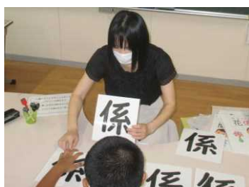
★通級指導教室の自立活動

研究主題に「進んで学習する子どもの育成～ICTの活用による授業づくりを通して～」を掲げています。ICTの活用を図り、子どもたちが各教科等の特質に応じた見方・考え方を働かせながら、主体的・対話的で深い学びのある授業への改善に向けて研修を重ねています。また、特別支援教育においては、子どもの個々の発達の特性を踏まえた指導・支援の在り方を重点に研修を重ねています。先月には、県教育庁中央教育事務所の指導主事を招き、特別支援教育セミナーと算数科、体育科の授業研究会を行いました。