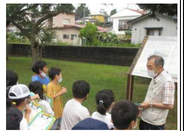
★旧船川線防波堤を前に

また、市ジオパーク学習センターの指導員さんからは、かつて男鹿で発生した地震や地震発生メカニズムなどについて教えていただきました。