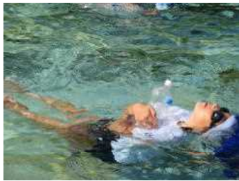
★2本のペットボトルを抱えて

子どもたちは、水を含んだ衣服が体にまとわり付くことで、重たさや動きにくさ等の違和感を感じていました。また、空ペットボトルを抱きかかえて、体を浮かす体験もしました。いざというときに、慌てずに、身の周りの物を使って自分や他の人の命を守るこの大切さを知ることができました。