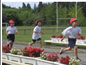
★校庭を力走する1年生

早朝の雨で開催が心配されましたが、秋晴れのもと、低、中、高学団ごとに「くじらっこ持久走大会」が行われました。体育科の時間を中心に、練習を重ねてきた子どもたちです。練習の記録や昨年度の順位を上回ろうと自分なりのめあてをもって競技に臨みました。