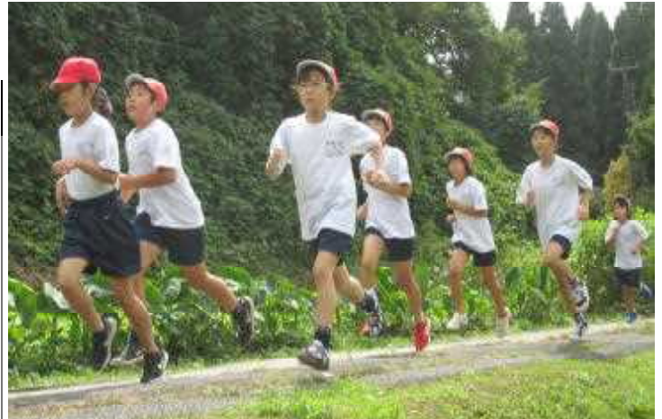
★秋の風を感じて…くじらっこ持久走大会、4年生の力走から

◆小学生の頃、「たいふういっかの青空」と伝えるニュースキャスターや気象予報士の言葉を、「台風一家の青空」としばらく勘違いしていたことがあります。もちろん正しくは、「台風一過の青空」です。文脈を考えればその間違いに気付くはずなのですが、暴風を伴う台風の怖さと、反社会集団の怖さとが重なり、「一家」という語句を連想したからです。現在進行形で北上している台風16号。何事もなく過ぎ去り、秋晴れをもたらしてほしいものです◆さて、前学期も残すところ、1週間となりました。新年度を迎えた4月から保護者の皆様方には、新型コロナウイルス感染症の拡大が予断を許さない中、学校の拡大防止対策にご協力していただき、ご家庭でも細心のご配慮をしていただき、本当にありがとうございます◆なべっこは中止となりますが、他の予定されていた学校主催の行事や学習活動はほぼ計画通りに実施できる見通しです。学校での生活・学習を通して、子どもたちは確実に成長しています。前向きに取り組もうとする学習活動や完成した学習作品、休み時間の様子などからひしひしと感じ取れます◆ある朝、前夜の強風で倒れた1年生の朝顔の鉢、複数を誰に頼まれたわけでもなく、ランドセルを背負いながら、黙々と立て直す他学年児童の姿がありました。大根畑の様子を見に行く途中のようでした。その姿には、誰かのために、何ができるかを考え、実行できる誠実さと優しさが映し出されています。これも、くじらっこの成長の証のひとつです◆来週、4日間の秋季休業を経て、後学期になります。子どもたちのますますの成長と、「コロナ一過の青空」の訪れを願いながら、後学期を迎えたいと思います。