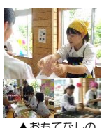
▲おもてなしの心で