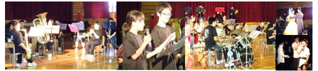
▲3年生部員にとって最後の演奏になった、感動的な吹奏楽部のステージ