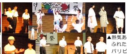
▲熱気あふれたパリピステージ