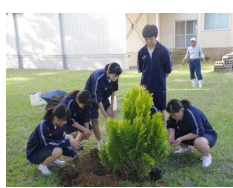
成長に願いを込めて

◆9月15日 緑の募金還元事業 市から「緑の募金還元事業交付金」をいただき、学校の南側にある広場に生徒会執行部のみなさんが代表して植栽を行いました。植えた4種類の木と花言葉は、「モッコク：人情家」、「キンモクセイ：気高い人」、「クロガネモチ：魅力・出世」、「フォーエバーゴールド：固い友情」です。しっかりと大地に根付くよう、協力して丁寧に植えました。