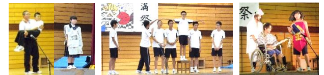
▲総合的な学習の時間の成果を披露した学年発表(左から1年、2年、3年)