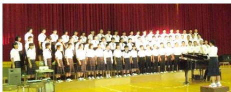
▲会場一杯に歌声を響かせた全校合唱「COSMOS」