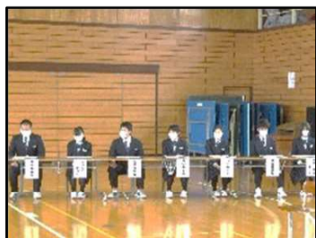
▲質問を真剣に聞く各委員会委員長