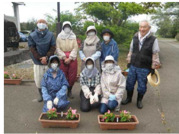
▲道村町内水保全友の会の方々