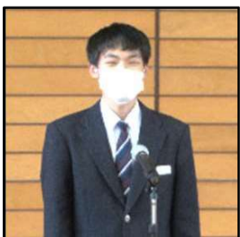
▲生徒会長のスローガン等の説明

一人一人が潟西中学校の新たな歴史と伝統を築いていってくださることを願っています。