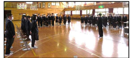
▲全校生徒による「いじめゼロ宣言」