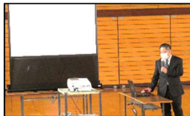
▲アンケート結果等の説明

「いじめを絶対に許さない」という毅然とした態度と、相手を尊重し思いやりをもった行動をとり、安全・安心で楽しい潟西中学校を創っていくことを願っています。