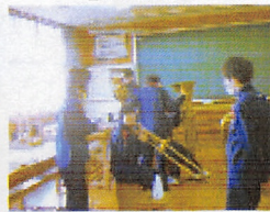
▲上級生の熱心な指導