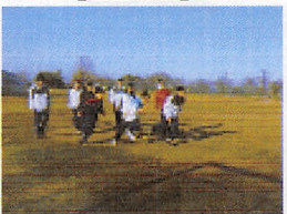
▲一緒にウォーミングアップ

練習試合や各種大会、合同練習等は、今のところ残念ながら中止の状態が続いています。この4月、各部には新入部員が入部し、先輩がリードしたり日々元気に練習に励んだりする様子が見られます。