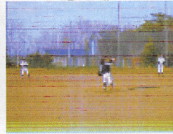
▲みんなでキャッチボール