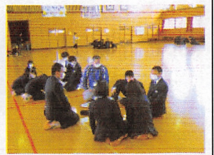
▲地区ごとに避難場所等の確認

4月17日に行われた防災集会では、地区ごとに休日等の災害時の避難場所を確認したり、安否報告先の生徒を決めたりしました。自分や地域の安心・安全のために、自ら危険を予測・察知し、回避する知識・技能を高められるように指導を継続していきます。なお、今年度も10月に地域と合同の防災集会・避難訓練を計画しております。