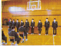
▲生徒会執行部の紹介