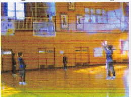
▲3ポイントシュート練習

現時点では、県総体や市郡の総体の開催も未定ですが、自分や目標と向き合い、ひたむきに努力し、チャレンジする精神を身に付けて欲しいと思います。